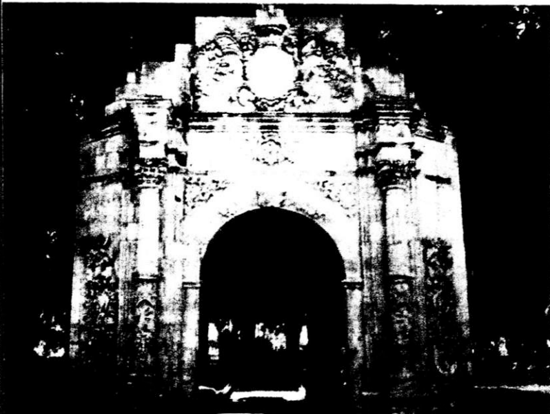
ARCO DEL PARQUE DEL MONTICULO Jorge Ruíz