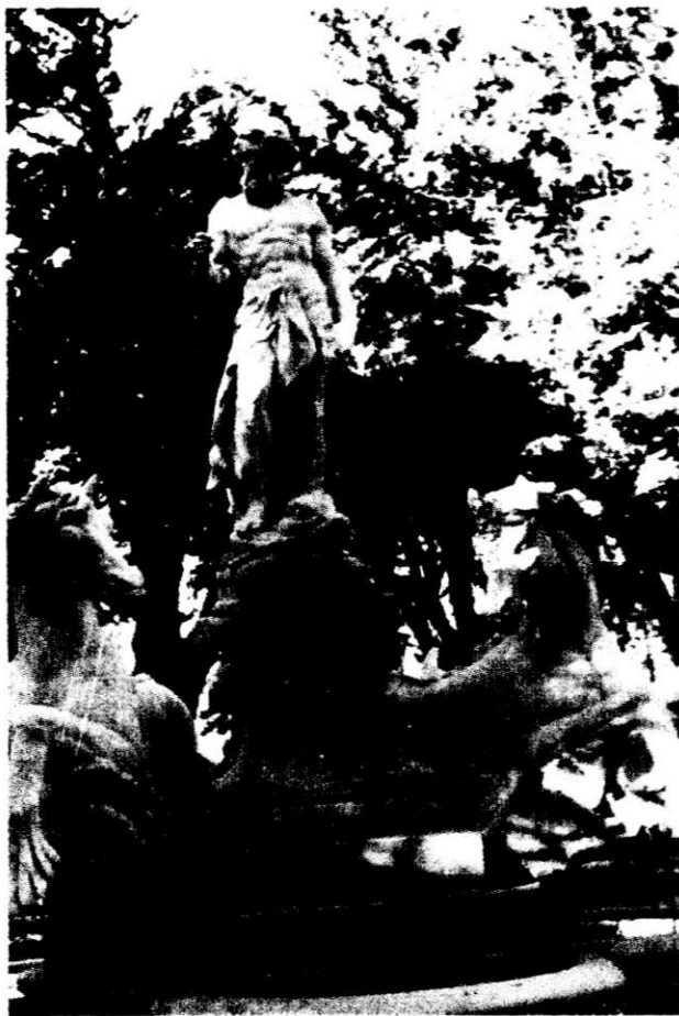
FUENTE DEL PARQUE DEL MONTICULO

En tanto, el niño campanero agita las cuerdas en alegre ritmo, llamando a la próxima misa. Y, en la puerta del templo, las "veleras" se aprestan a vender los últimos cirios; los pequeños se disponen a salir, disparados, hacia el parque y los perros baten la cola, esperando su ración de mendrugos.