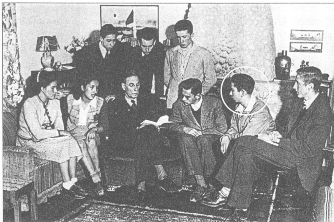
Sección de reflexión sobre temas de espiritualidad a cargo de un expositor y alumnos de varios cursos del "Amerinst".